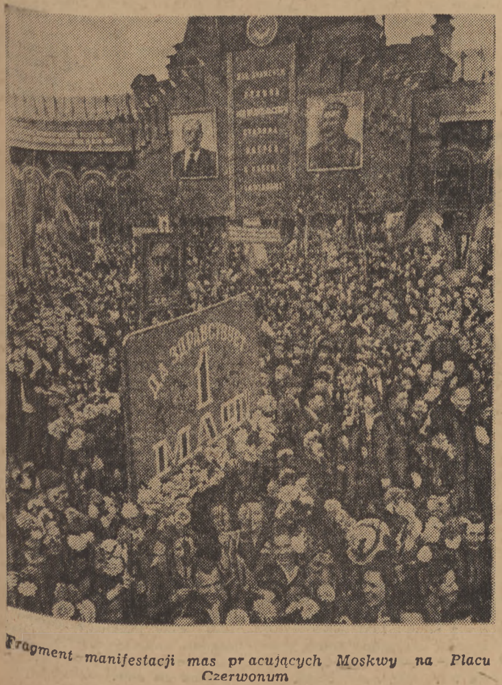
Fragment manifestacji mas pracujących Moskwy na Placu Czerwonym