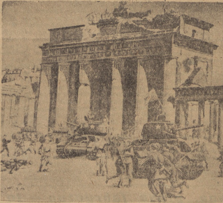
Obraz Leona Wróblewskiego pod tytułem „Spotkanie”

Z uczuciem głębokim wzruszenia myślmy dziś, po