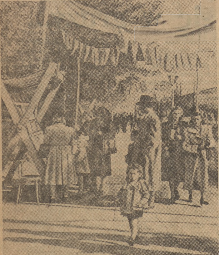
W różnych punktach Warszawy „Dom Książki” urządził uliczne stoiska z książkami. Na zdjęciu stoisko przy ul. Mickiewicza na Żoliborzu.