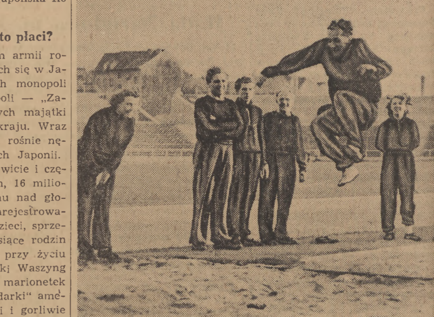
Na stadionie im. Waltera Ulbrichta w Berlinie przygotowują się sportowcy do zdobycia odznaki sprawności fizycznej. Na zdjęciu członkowie Robotniczego Stowarzyszenia Sportowego „Jedność” skupiającego robotników z berlińskich zakładów pracy, trenując skoki w dal.