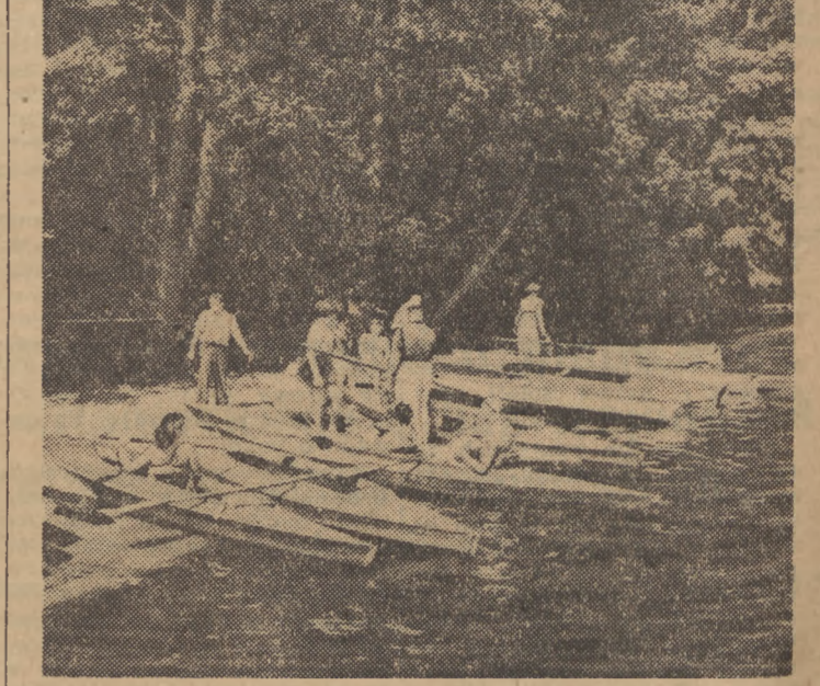
Piękno jezior mazurskich ściga co roku liczne rzesze uczestników i miłośników sportów wodnych.