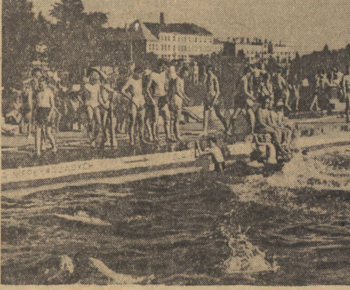
Podczas trwających od kilku dni upałów jest gwaro i rojno na pływalni Centralnego Wojskowego Klubu Sportowego.

Podczas trwających od kilku dni upałów jest gwaro i rojno na pływalni Centralnego Wojskowego Klubu Sportowego.