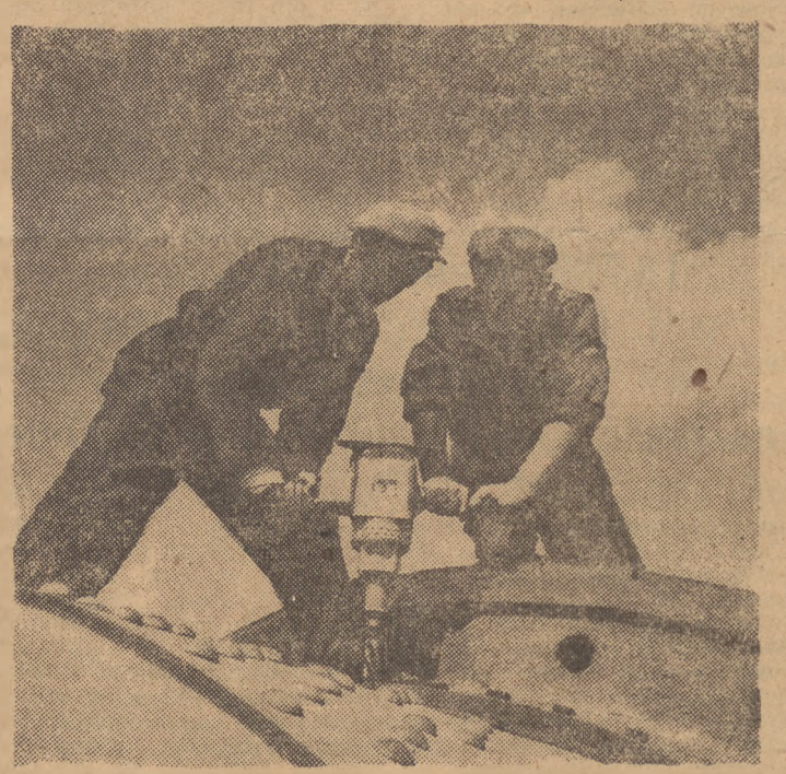
Na maciuce robotników budujących wielką cemenrownię w Wierzbicy, monterzy Stanisław Szewc i Aleksander Sasal subskrybowali Narodowy Pożyteczny Sił Rozwoju Polski w wysokości 14-dniowego zarobku. Na zdjęciu: obaj monterzy przy wierceniu otworów w trzonie pieca.