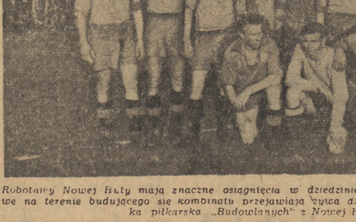
Robotnicy Nowej Huty mają znaczne osiągnięcia w dziedzinie rozwoju sportu. Kola sportowe na terenie budującego się kombinatu przejawiają żywą działalność. Na zdjęciu: jednostka piłkarska „Budowlanych” z Nowej Huty.

głosu. Obie bramki zdobył Gracz. Widzów 15.000.