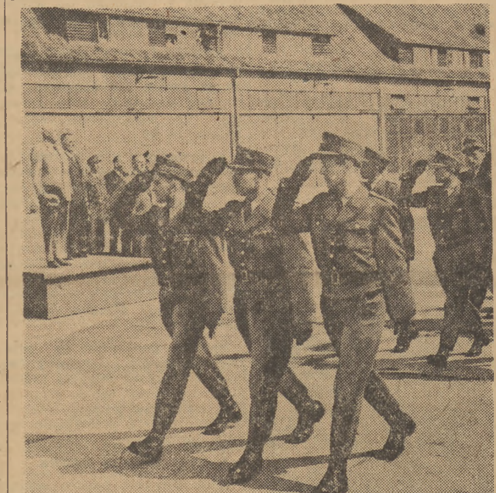
Bonnski minister policji - Lehr przyjmuje pierwszą parade oficerów i podoficerów nowego Wehrmachtu w koszarach św. Huberta w Lubece.