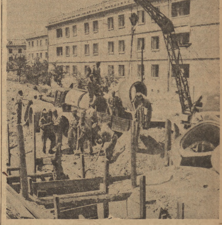
Na terenie budowy Nowej Huty roboty pomocnicze wykonują junacy 43 brygady SP. Na zdjęciu: junacy tej brygady w czasie budowy głównego kanału w dzielnicy C 2.