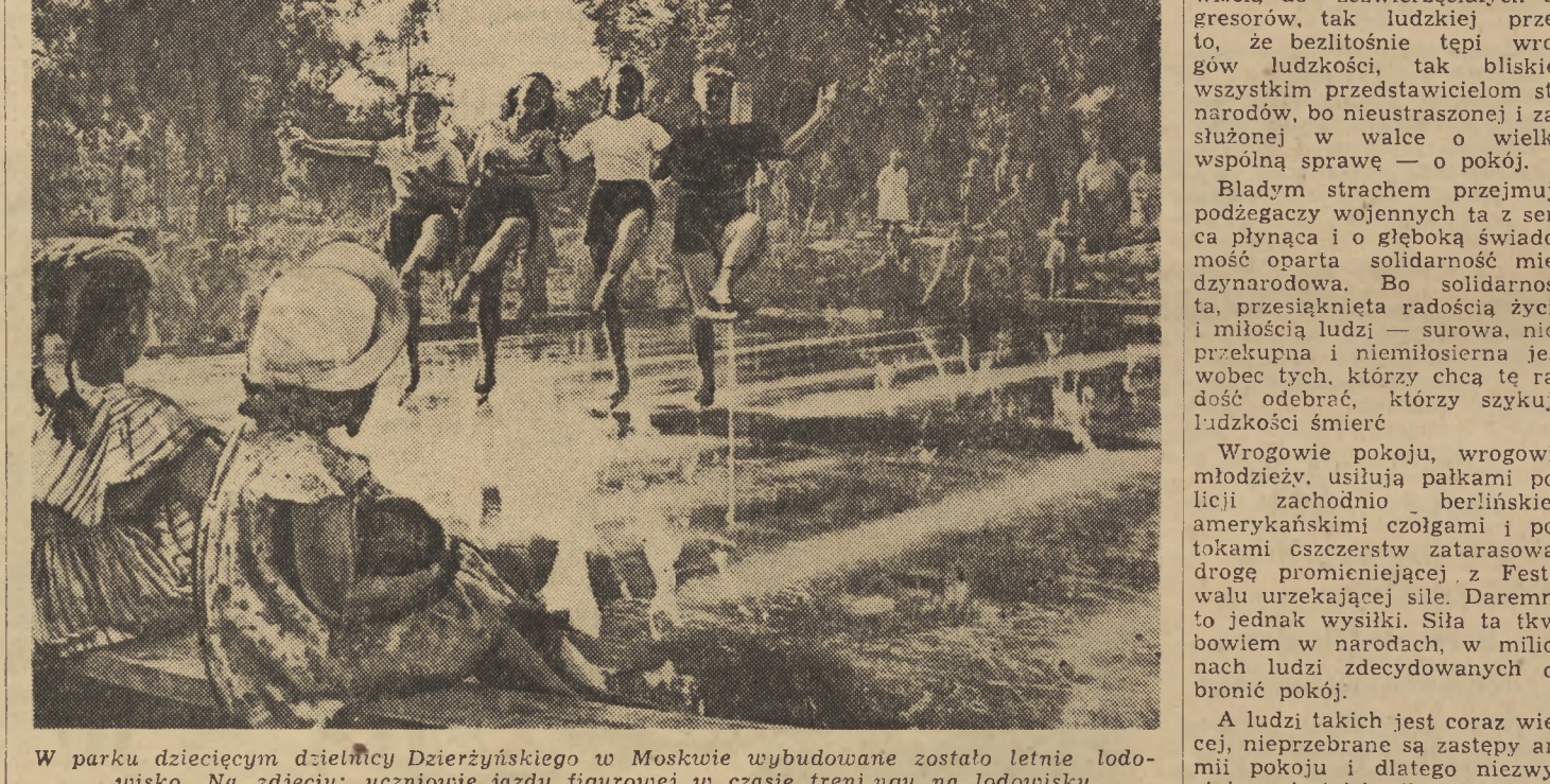
W parku dziecięcym dzielnicy Dzierżyńskiego w Moskwie wybudowane zostało letnie lodowisko. Na zdjęciu: uczniowie jazdy figurowej w czasie treningu na lodowisku