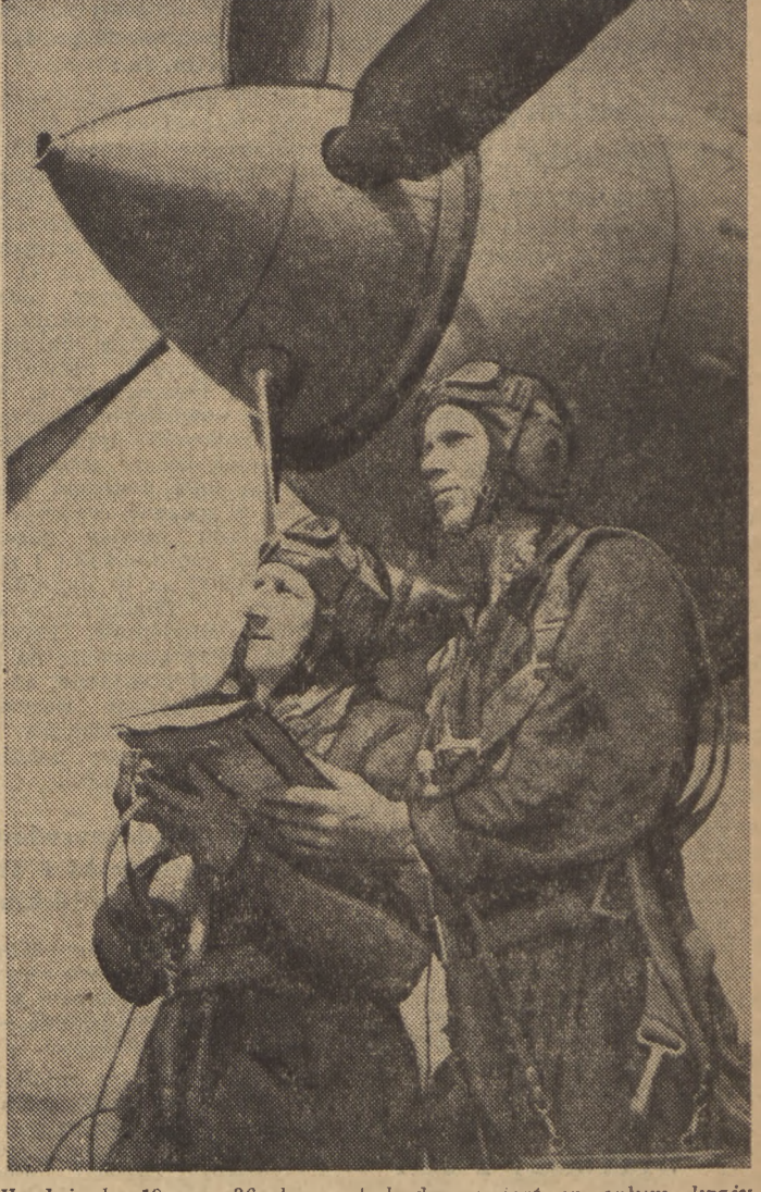
W dniach 19 — 26 bm. obchodzony jest w całym kraju V „Tydzień Lotnictwa”. W okresie tym odbędą się liczne pokazy lotnicze, imprezy i pogadanki. Na zdjęciu: piloci jednostki lotniczej przed startem.