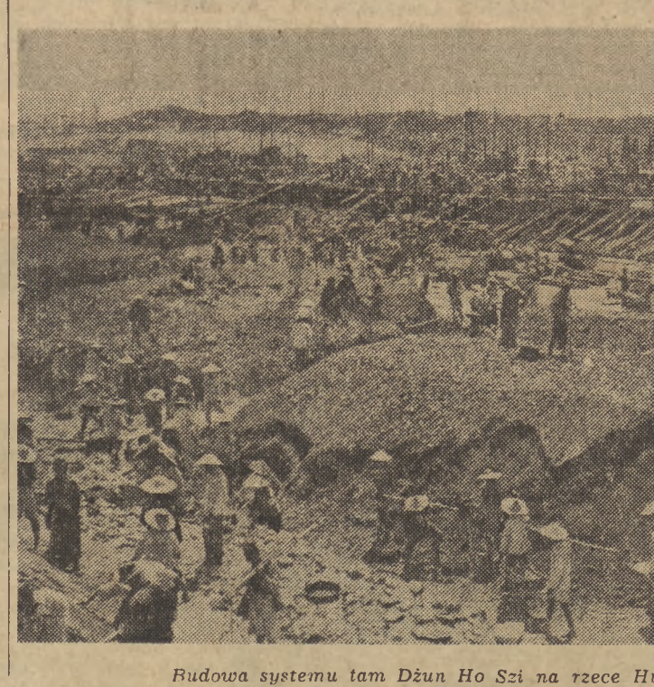
Budowa systemu tam Dzun Ho Szi na rzece Huai prow. Anhwei