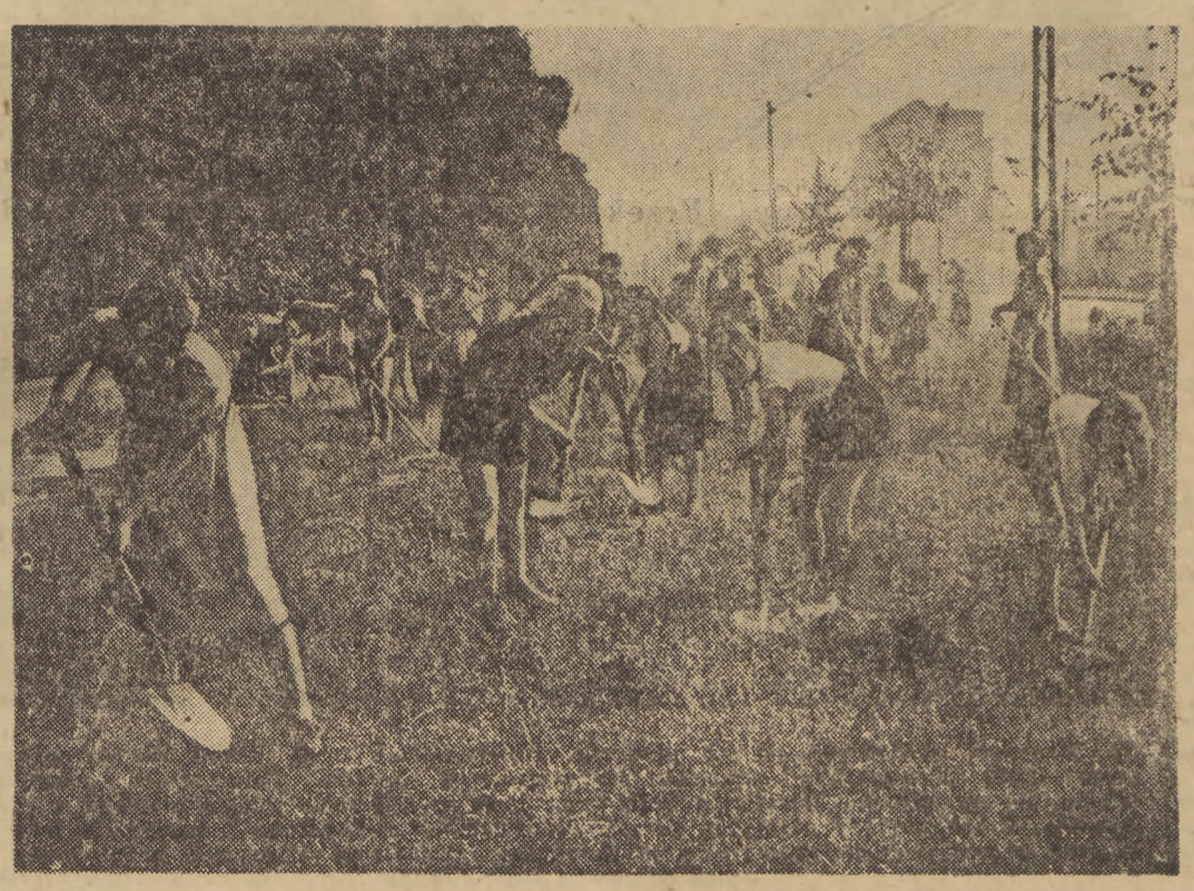
Młodzież bierze czynny udział w budowie nowej Warszawy. Na zdjęciu: uczennice liceum dla wychowawczyń przedszkoli w czasie prac porządkowych u Alei Waszyngtona.