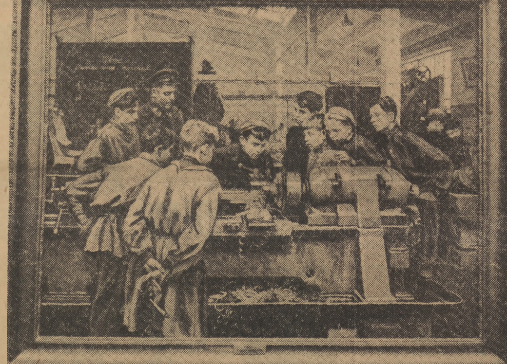
W gmachu „Zachęty” w Warszawie odbyło się w dniu 15 bm. uroczyste otwarcie pierwszej w Polsce wystawy prac plastyków radzieckich. Na zdjęciu: obraz G. E. Satel „W szkole rzemieślniczej Nowy temat”

W gmachu „Zachęty” w Warszawie odbyło się w dniu 15 bm. uroczyste otwarcie pierwszej w Polsce wystawy prac plastyków radzieckich.