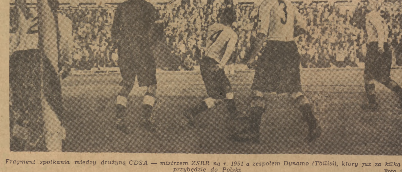
Fragment spotkania między drużyną CDSA - mistrzem ZSRR na r. 1951 a zespołem Dynamo (Tbilisi), który już za kilka dni przybędzie do Polski.

W bieżącym tygodniu przybywa do Polski wicemistrz piłkarski ZSRR, Dynamo Tbilisi, który zagra na terenie kraju kilka spotkań. Będzie to druga wizyta piłkarzy radzieckich w Polsce (w 1946 r. gościłymi były drużyny moskiewskiego Torpeda).