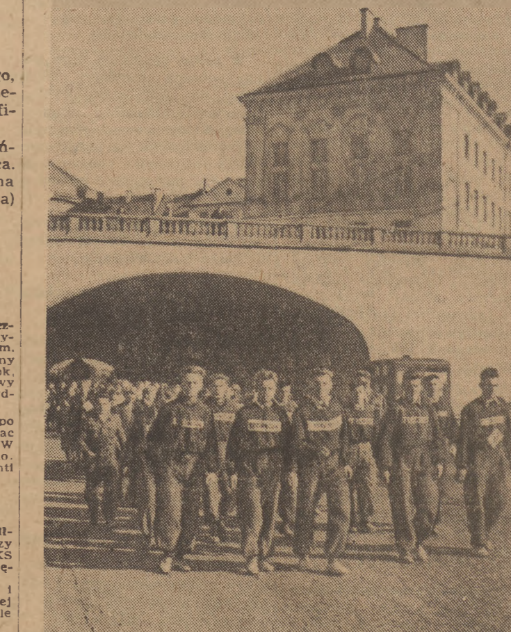
W niedzielę, 21 bm. w całym kraju odbyła się druga tura marszów jesiennych „Szlakami Zwycięstw”. Na zdjęciu: grupa sportowców w czasie marszu na trasie W-Z.