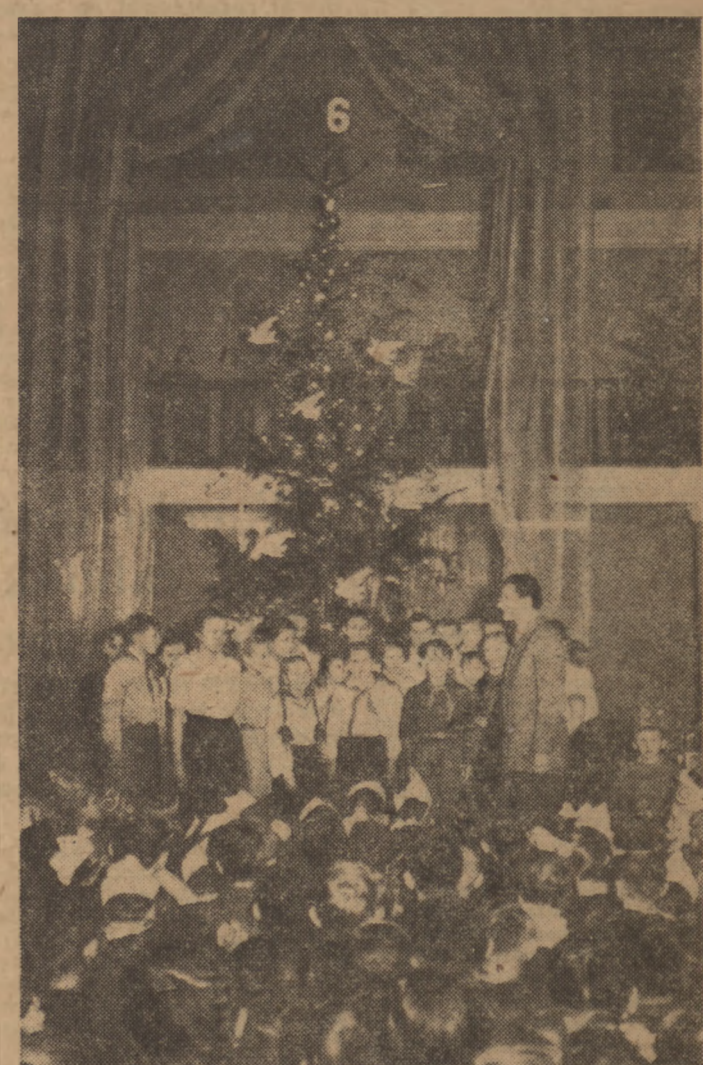
Towarzystwo Przyjaciół Dzieci zorganizowało w dniu 28 bm. w Warszawie imprezę noworoczną dla uczniów szkół. Jest to pierwsza z szeregu imprez TPD organizującą do dnia 12 stycznia 1952 roku dla 12 tysięcy dzieci stolicy, miast powiatowych i wsi spolszczonych. Na zdjęciu: młodzież przed choinką noworoczną.