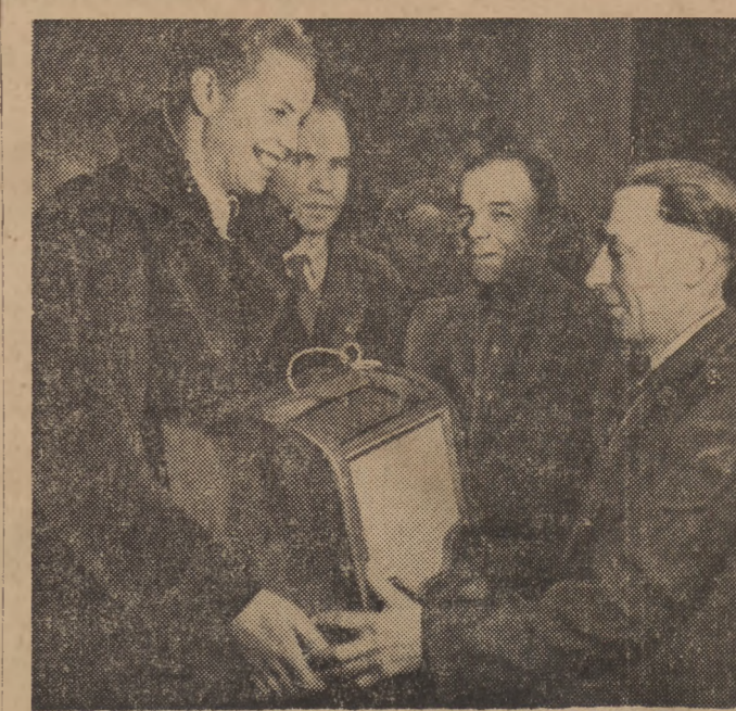
Gromada Kopalnia w woj. wrocławskim wykonała plan kontraktacji trzody chlewnej na pierwszy kwartał 1952 roku w 150 procentach, realizując tym swoje zobowiązanie podjęte we wstępnym do wszystkich chłopów Dolnego Śląska, aby wykonali i zrekonstruowali plany kontraktacji trzody chlewnej. Na zdjęciu: przedstawiciel woj. Zarządu ZSCh przekazuje gromadzie Kopalnia radioodbiornik „Aga” i komplet książek dla gromadzkiej biblioteki, ofiarowany w nagrodę za osiągnięcia w gospodarowaniu i w dowód uznania za świadomą i patriotyczną postawę.