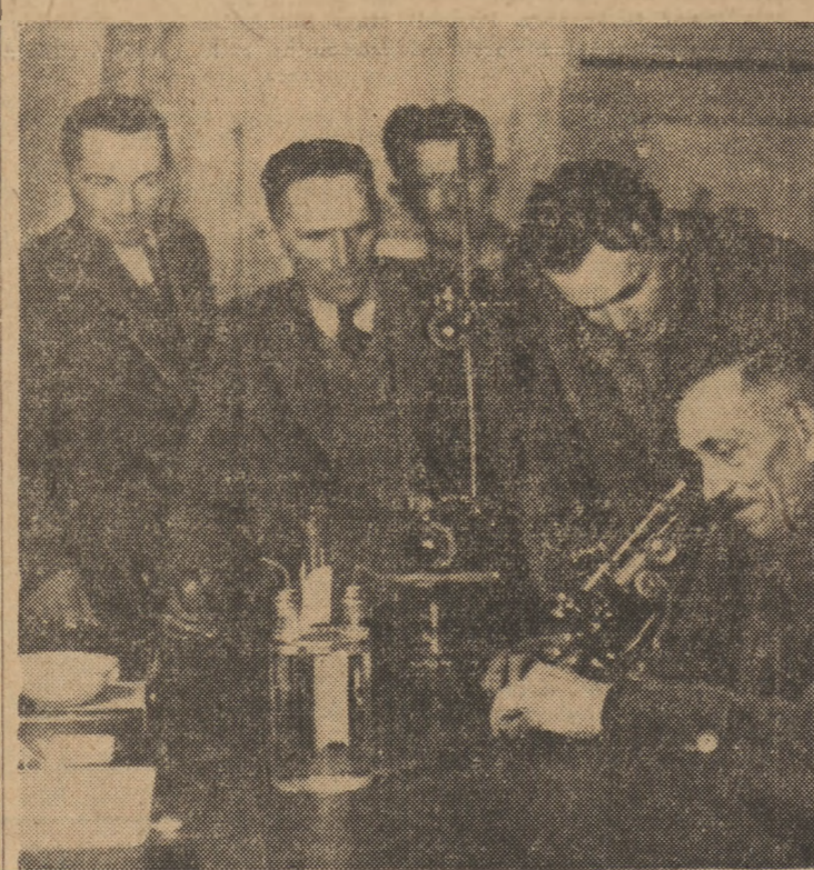
Chłopi — miczurinowcy woj. poznańskiego propagują nowe zdobycze rolnicze, oparte na wiedzy agronomicznej. Podczas ostatniego zjazdu w Borzęckich, gdzie miczurinowcy spotkali się z naukowcami Uniwersytetu Poznańskiego, omówiono m. in. możliwość wprowadzenia dyni olejistej jako paszy dla zwierząt domowych. Na zdjęciu chłopi-miczurinowcy zwiędają wzorową chatę — laboratorium.