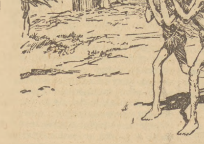
Oto obrazek, na którym widzimy jeden ze sposobów wyzisku i upodlenia w XX wieku kolorowych ludów kolonialnych...

Oto obrazek, na którym widzimy jeden ze sposobów wyzisku i upodlenia w XX wieku kolorowych ludów kolonialnych. Ludzie ci walczą dziś z coraz większym powodzeniem o swoje prawo, o prawo do życia godnego człowieka.