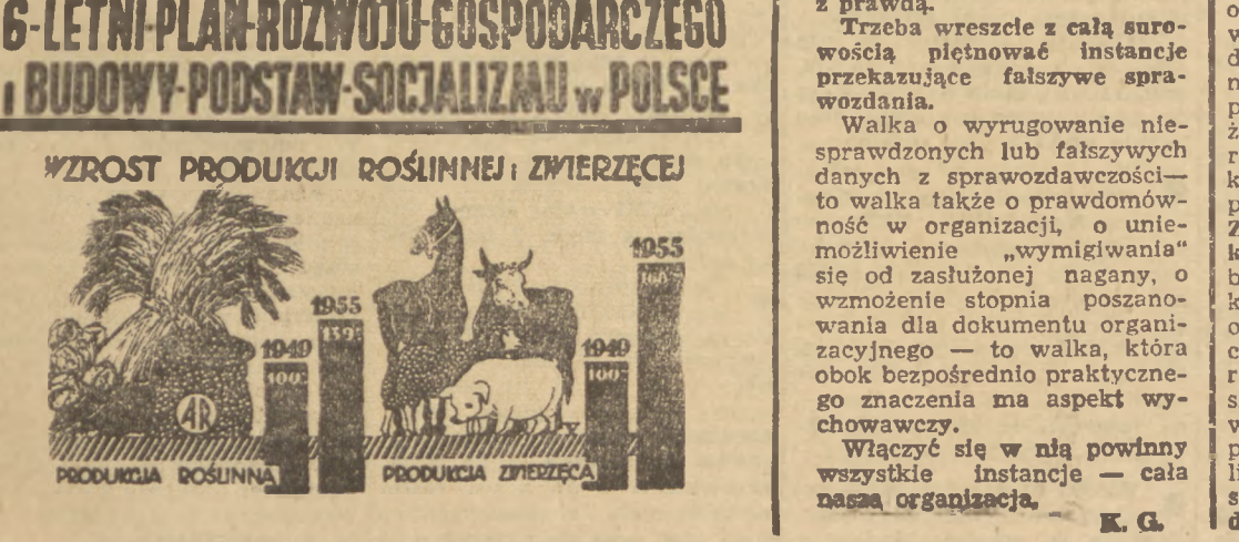
6-LETNI PLAN ROZWOJU GOSPODARCZEGO I BUDOWY PODSTAW SOCJALIZMU W POLSCE