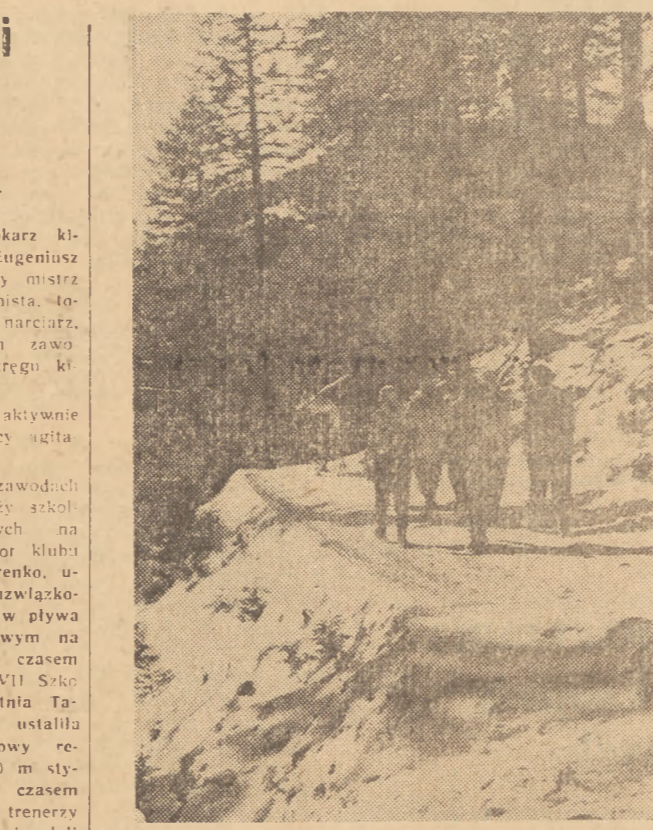
W najpiękniejszych miejscowościach Polski spędają wakacje w domach wypoczynkowych FWP szerokie rzesze ludzi pracy.