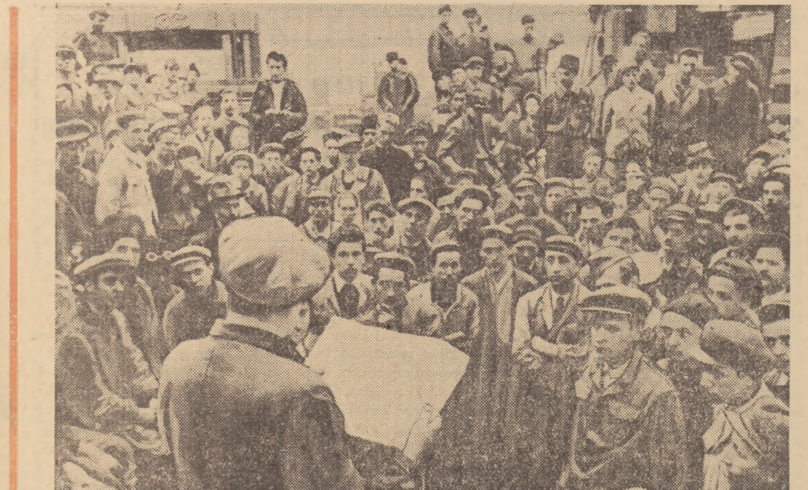
Wywiad udzielony przez tow. Stalina przedstawicielowi „Prawdy”, wywołał głębokie wrażenie wśród mas pracujących Rumuńskiej Republiki Ludowej...