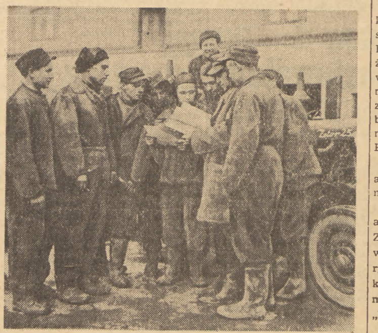
Dzięki dobrze zorganizowanej pracy zespołowej, maszyny i traktory POM-u w Trzeboszowicach są już przygotowane do wjazdu w teren.