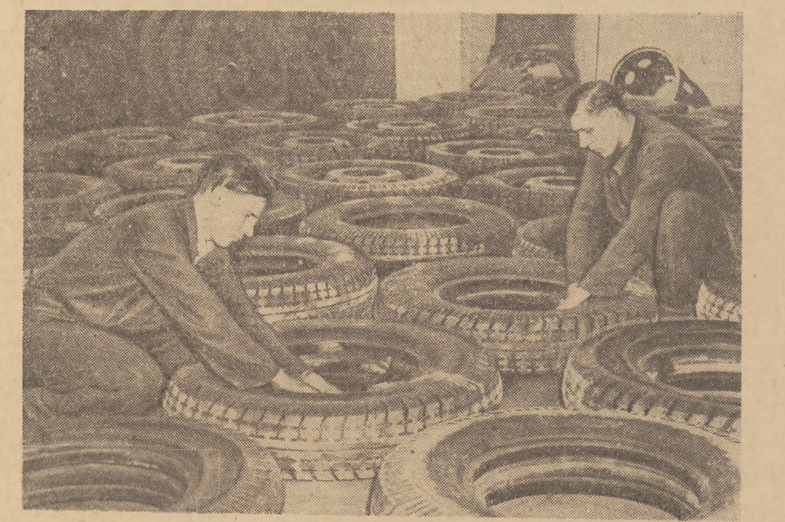
W Zakładach Starachowickich po raz pierwszy w polskim przemyśle maszynowym rozpoczęła się taśmowa produkcja samochodów...