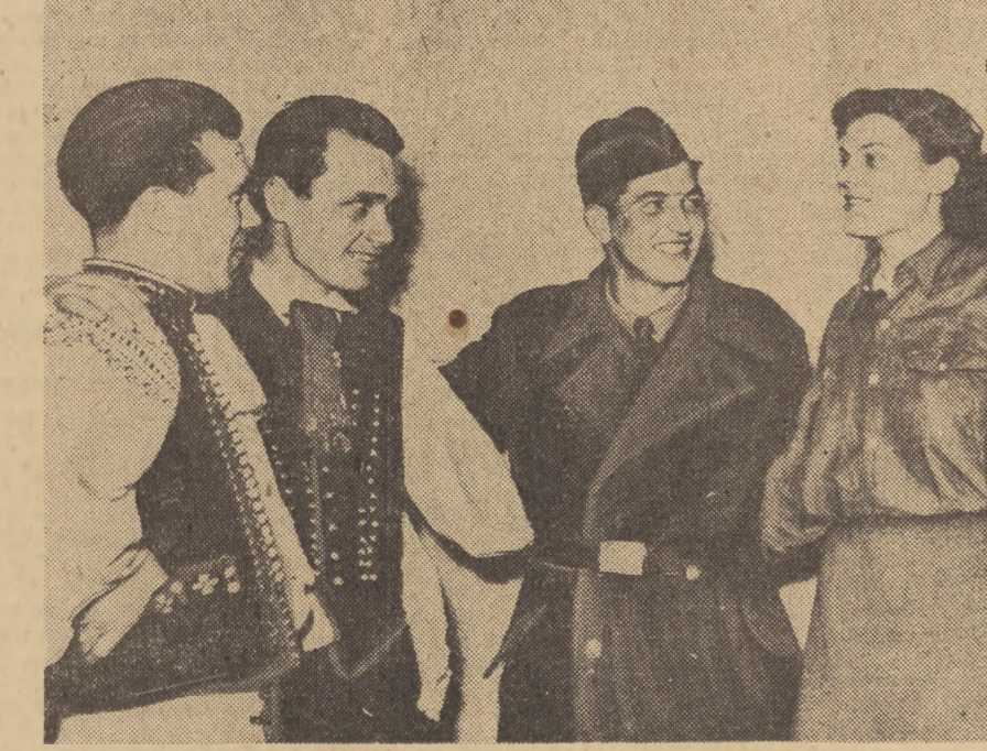
W Komarom odbyło się spotkanie mlodziezowe czechosłowacko-węgierskie...