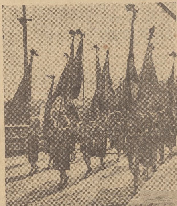
Młodzież niemiecka przechodzi most na Nysie, udając się z przyjacielską wizytą do Zgorzelca.

10 miesięcy temu premierzy Polski i NRD — JÓZEF CYRANKIEWICZ i OTTO GROTEWOHL w imieniu swych narodów podpisali w Zgorzelcu nad Nysą układ o wytyczeniu istniejącej i ustalonej granicy pomiędzy Polską a Niemiecką Republiką Demokratyczną na Odrze i Nysie.