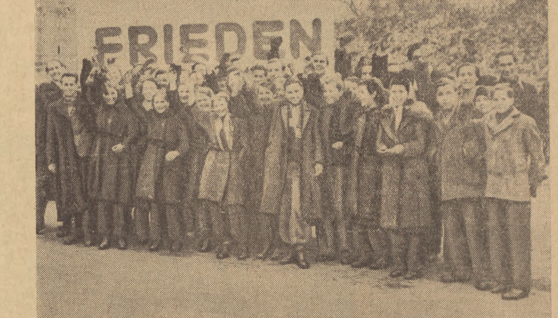
Takich spotkań się nie zapomina! Będziemy toczyli nadal walkę o pokój po obu brzegach Odry i Nysy — będziemy toczyli ją wspólnie.