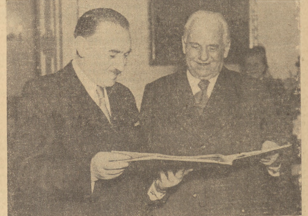
W grudniu ub. r. gościł w Warszawie Prezydent Wilhelm Pieck. Na zdjęciu widzimy Prezydenta Wilhelma Piecka i Prezydenta Bolesława Bieruta w Berlinie.

frontem kompanii honorowej policji ludowej, której hasło dnia brzmiało: „Wieczna przyjaźń pomiędzy narodami polskim i niemieckim“. Następnie Premier Grotewohl i Prezydent Bierut ogłosili przemówienia, które podajemy oddzielnie. Urząd Informacji Niemieckiej Republiki Demokratycznej ogłosił komunikat, w którym stwierdza: Jesteśmy świadkami wydarzenia o wielkiej doniosłości w sferze narodowej i międzynarodowej. Ludność stolicy Niemiec wita Prezydenta Rzeczypospolitej Polskiej Bolesława Bieruta. W godzinach tych wizer przyjaźni między narodem polskim a niemieckim jeszcze bardziej się zacieśniają. Wszyscy mitujący pokój Niemcy spoglądają teraz na Berlin i uczestniczą w tym wydarzeniu, które przetrwa się do zapewnienia pokoju i szczęśliwej przyszłości narodów Europejskich. (Sprawozdanie z pobytu Prezydenta Bolesława Bieruta w NRD podajemy na str. 2).