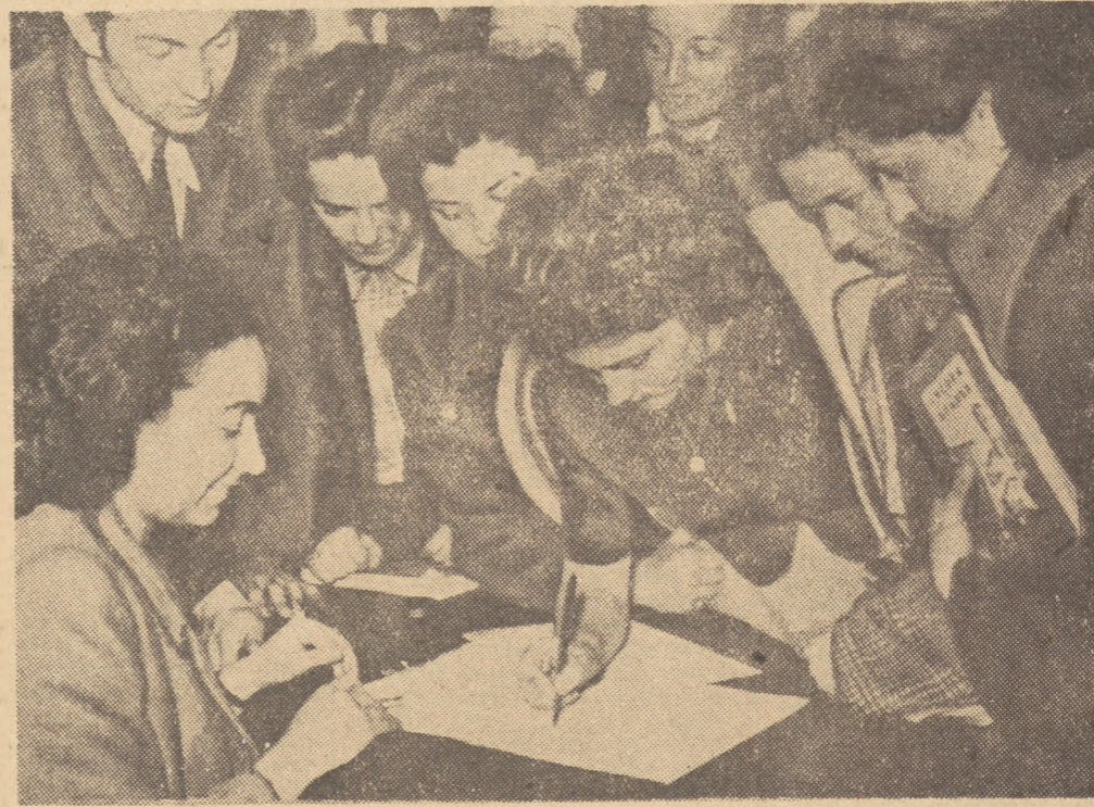
W dniu 10 kwietnia 1951 r. w całej Rumuńskiej Republice Demokratycznej rozpoczęła została kampania zbierania podpisów pod Apelem Światowej Rady Pokoju...