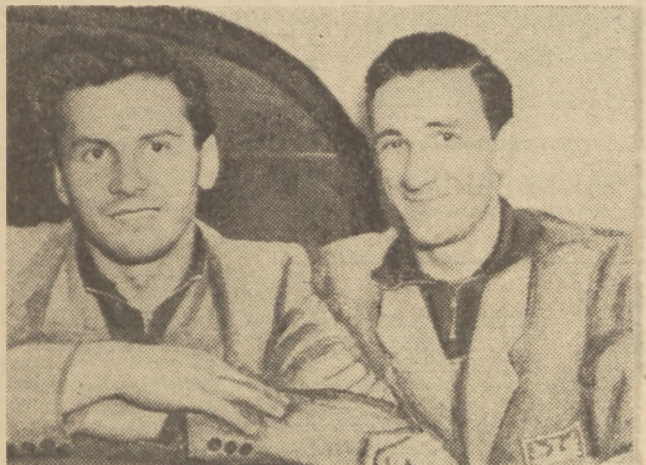
Do Warszawy powrócili z Moskwy nasi lekkoatleci, którzy brali udział w trójmeczach, między ZSRR, Rumunią i Polską.

Była godzina 15-ta, kiedy w czwartek dnia 26. bm. na dworcu w Terespolu zatrzymał się pociąg, wiozący do Warszawy naszych lekkoatletów, wracających z dwutygodniowego pobytu w Związku Radzieckim.