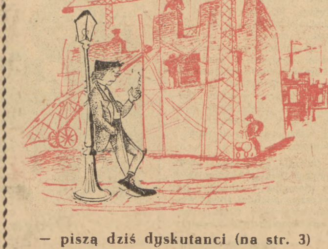
— piszą dziś dyskutanci (na str. 3)