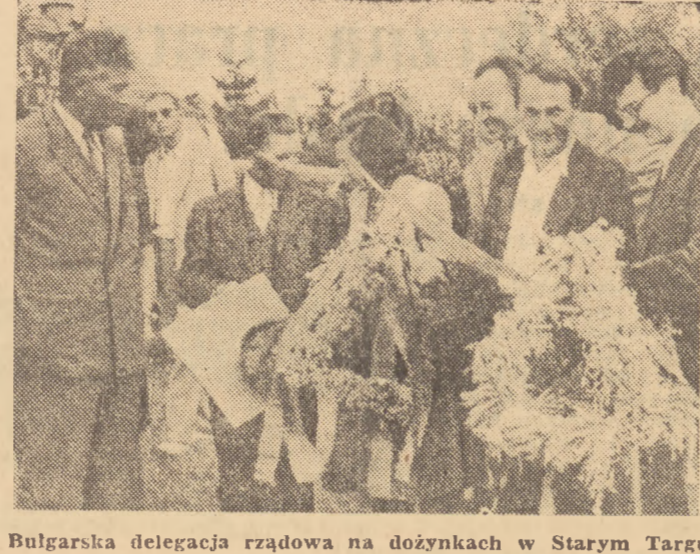
Bułgarska delegacja rządowa na dożynkach w Starym Targu.

Warszawa, wtorek 11 września 1951 r. Nr 216 (424) B Cena 15 gr