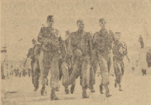
Najrówniej maszerowali ambitni kadeci, wojsko i młodzież SP. Raźnym krokiem i z uśmiechem na ustach marszeruje 10-zespół SP-owców.

Start. W kolejnych minutowych odstępach rozpoczęły marsz 10-ciu osobowe grupy młodzieży. Drużyna Spójni, która wiodła na zdjęciu, uchyliła dobry czas u marszu na 10 km, osiągając normę na odznakę SPO.