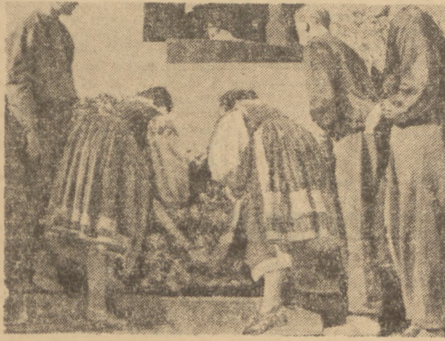
Delegacje zrzeszeń sportowych i organizacji społecznych towarzyszyły wieciami pod pomnikami. Na zdjęciu — delegacja LZS-u z powiatu płońskiego.