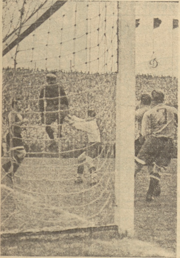
Oto jeden z emocjonujących momentów gry pod bramką Dynamowców.