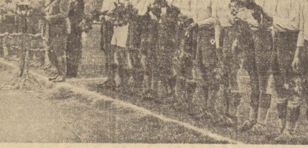
Po wyjściu na stadion, obie drużyny zostały powitane buziowymi i długo niemiłymi oklaskami przez 50-tysięczną widownię. Na zdjęciu moment powitania - drużyna CWKS na pierwszym planie.

W sumie zwyciężyła zasłużenie drużyna, brzoświeżniejsza, jaka była Dynamo.