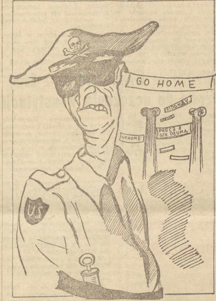
(rys. M. Grygullo)

Ridgway (udaje „Greka”) — Co oznaczają te transparenty...?