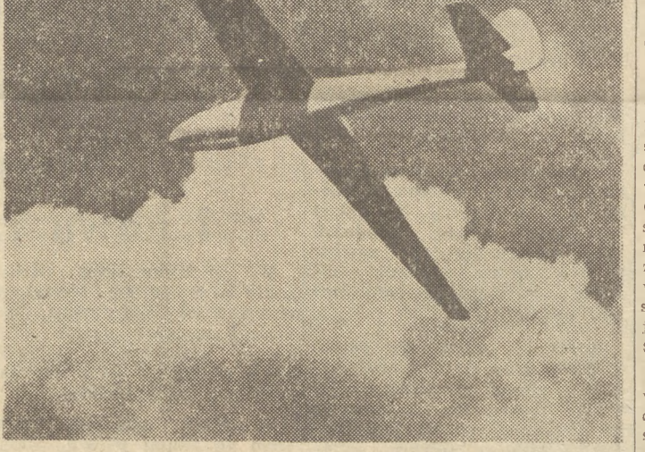
wykonnania następujących czynności:

W związku z ostatnimi, IX-mi Krajowymi Zawodami Szybowcowymi, czytelnicy często słyszeli o zdobywanych warunkach do złotych i diamentowych odznak. Ale nie wszyscy wiedzą, kto taką odznakę może zdobyć i jakie są niezbędne do tego warunki.