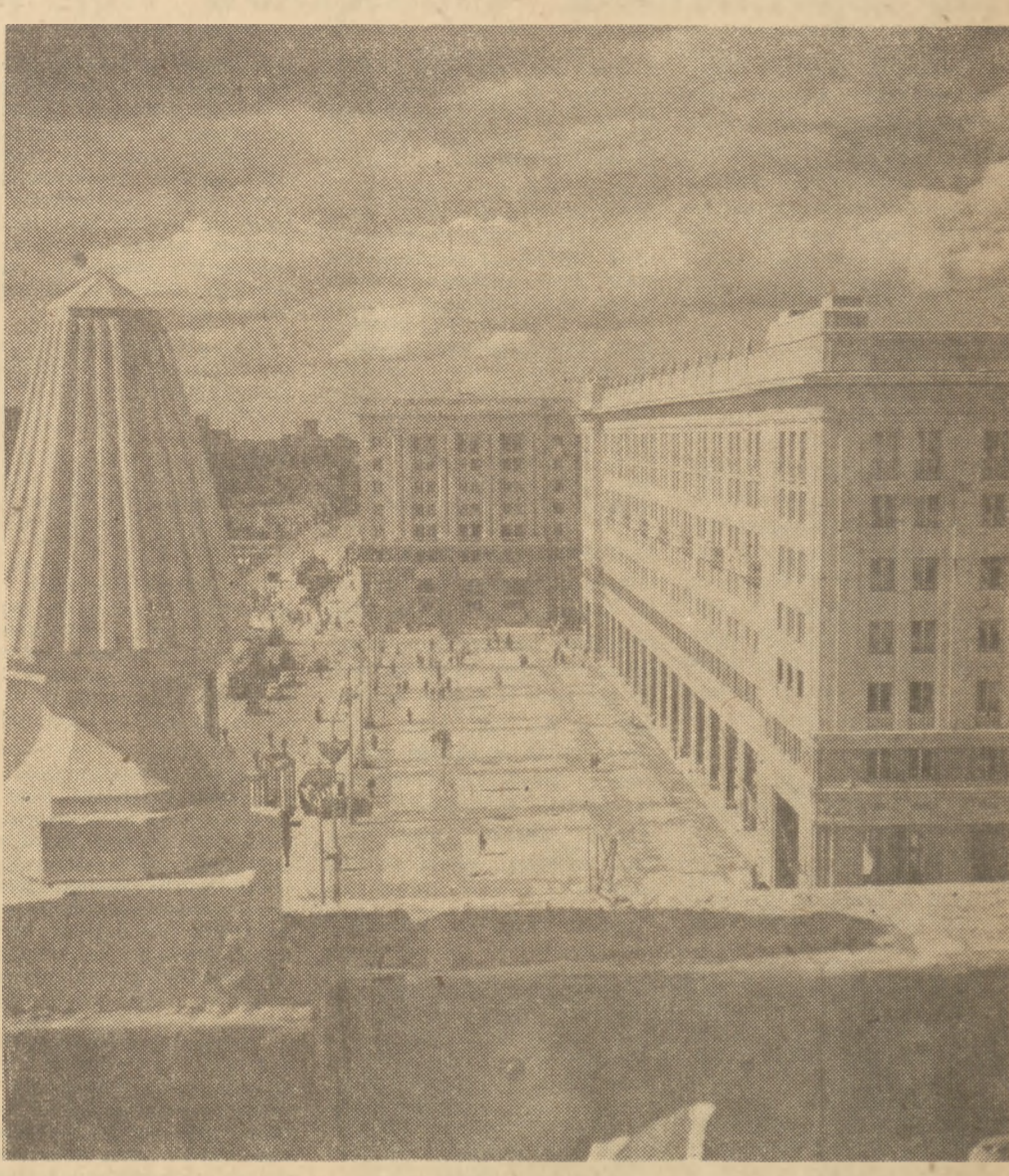
W czasie tegorocznego Miesiąca Budowy Warszawy mieszkańcy Stolicy będą pracowali jednocześnie w wielu punktach miasta, przy rozbiorze ruin, usuwaniu gruzu, przy budowie parków i zieleńców. Trzy główne punkty to:

WYBRZEŻE GDAŃSKIE — gdzie ma pracować oddzielnie 2.000 osób, 70 samochodów ciężarowych; trzeba tu uprzątnąć i wywieźć gruz, aby wybrzeże utworzyło spadek w stronę Wisły.