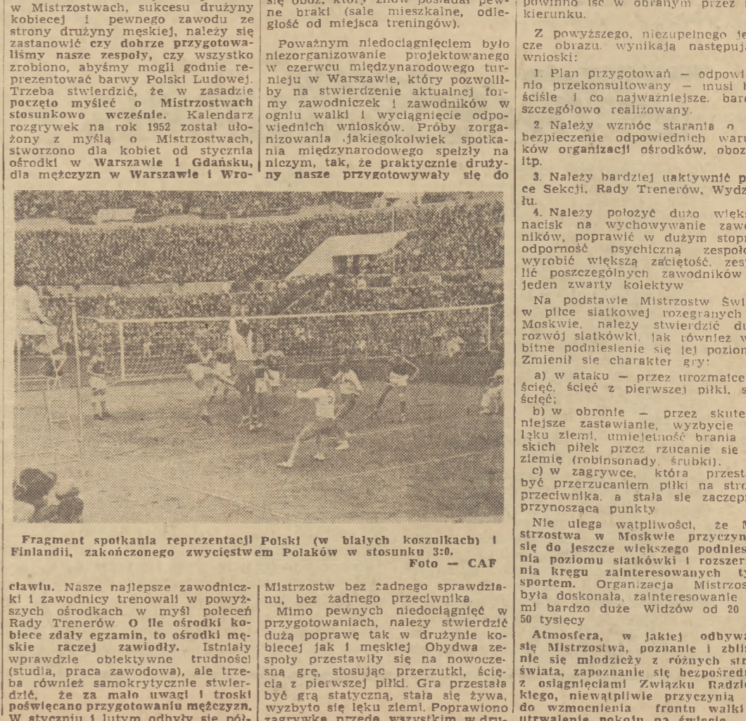
Drużyna męska Związku Radzieckiego.

Wieloletnie widać stały się tego osiągnięcia dopiero wówczas, gdy zaczął trenować w grupie zastępcy mistrza sportu Wania.