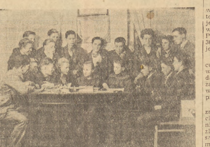
Równocześnie niemal pisali do Zarządu Głównego ZMP młodzi chłopcy z Cieszcina w woj. łódzkiej: „Chcemy pójść pracować tam, gdzie jest najtrudniej, gdzie jesteśmy najbardziej potrzebni Ojczyźnie”.