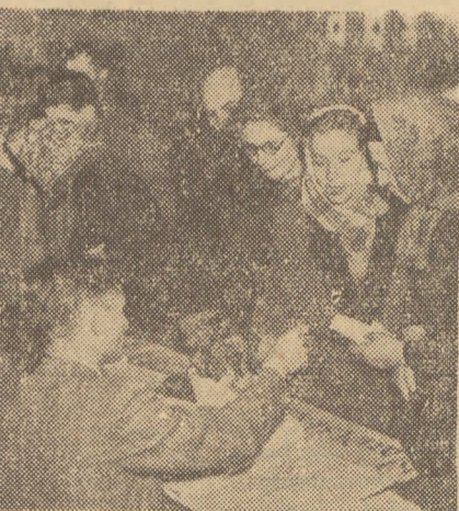
Obywatele Polskiej Rzeczypospolitej Ludowej głosowali masowo na kandydatów Frontu Narodowego; głosowali na szczęście i rozkwit swej Ojczyzny.