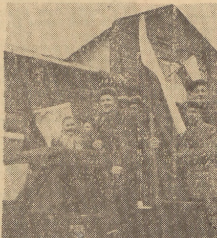
Robotnicy rolni z PGR-u Osmolin wczesnym rankiem pojechali samochodem do Komisji Wyborczej w Sannikach, aby oddać swe głosy na listę Frontu Narodowego.