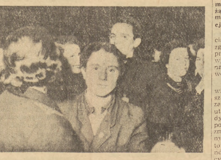
Po kilkunastu dniach pionierów woj. łódzkiego wyjeżdżających do pracy w kopalniach, serdecznie żegnała młodzież. A na zakończenie spotkania młodzieży z pionierami odbyła się wesela wczorajca.