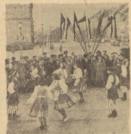
Przez cały dzień wyborów, na ulicach miast i miasteczek występowały młodzieżowe zespoły artystyczne oraz grupy agitacyjne. Widzimy młodzież na Placu Zamkowym w Warszawie.