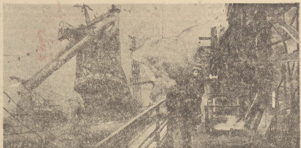
Przedtem kom. pracy, wszystkim pracownikom, całej młodzieży hut „Kościuszko“ w dniu święta 150-lecia istnienia zakładu przesyłamy najserdeczniejsze życzenia dalszych sukcesów w walce o stal, w pracy dla umocnienia Ojczyzny i światowego obozu pokoju.