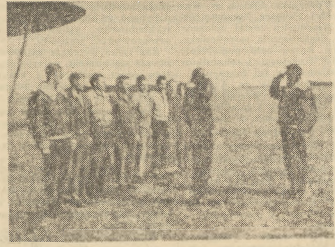
Przed rozpoczęciem lotów. — Dowódca grupy składa raport instruktorowi.