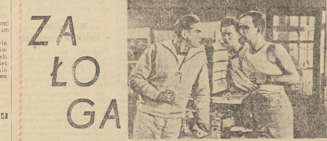
Scena sprzeczki między Bugajem, uczniem - bumelanem (pierwszy od lewej, gra R. PiekarSKI) a Krukciem, przewodniczącym kółka ZMP (pierwszy od prawej gra B. Ejsmont).