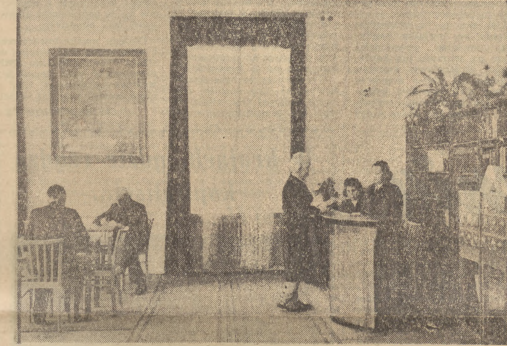
W dniu 31 br. stycznia nastąpiło w Warszawie uroczyste otwarcie Instytutu Polsko-Radzieckiego. Celem Instytutu jest upowszechnienie wiedzy o ZSRR, o historii, literaturze i sztuce narodów radzieckich i o stosunkach polsko-radzieckich. Na zdjęciu: Fragment czytelnicy Instytutu.

Stacja „Komsomolska-Okrężna” największą i najpiękniejszą w świecie W Moskwie odbyło się uroczyste otwarcie nowej linii metra — drugiego odcinka (tzw. linii okrężnej). Nowa linia o długości ponad 6 km, połączyła Dworzec Kurski z Dworcem Białoruskim. Na nowym odcinku linii okrężnej znajdują się cztery stacje podziemne — „Komsomolska-Okrężna”, „Ogród Botaniczny”, „Nowoslobodzka” i „Białoruska-Okrężna”. Każda z tych stacji jest wspaniałym pałacem podziemnym z granitu, marmuru i kryształów. Strope tych pałaców podziemnych podtrzymywane są przez potężne kolumny. Stacje te połączone są z powierzchnią schodami ruchomymi. Zdolność przepustowości stacji „Komsomolska-Okrężna”, największej i najpiękniejszej stacji metra, jaką kiedykolwiek zbudowano na świecie — wynosi 100 tys. pasażerów w ciągu godziny. Aby zmniejszyć sobie piękno stacji, wystarczy nadmienić, że mozaikę sklepienia wykonano m. in. z około 2,5 miliona