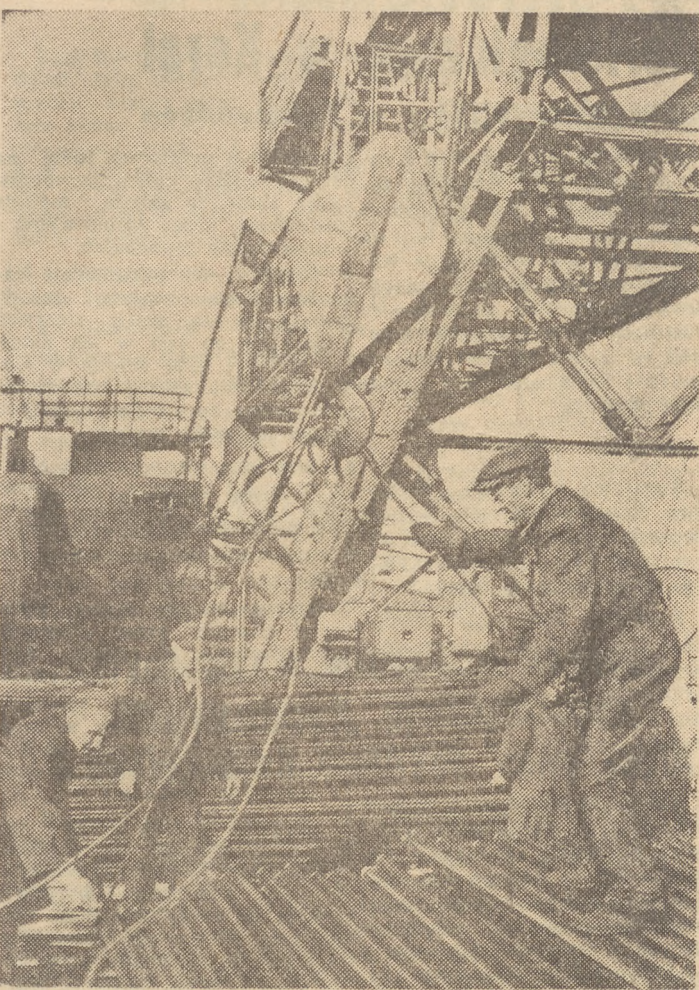
Przeladunek w portach polskich stale wzrasta. W ramach Planu 6-letniego zdolność przeladunkowa naszych portów wzrosnie do 32 milionów ton rocznie. Na zdjęciu: fragment zmechanizowanego przeladunku w porcie Gdyni.

Autoryzowani najciekawsze odpowiedzi otrzymają cenne nagrody.