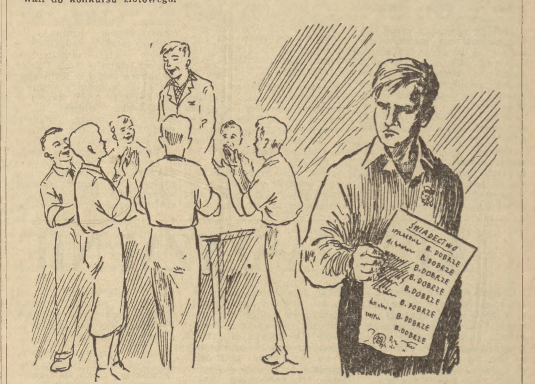
„Ale mnie urządzili! Teraz chodzę jak głupi z tym świadectwem bez dwój i z tą odznaką SPO...”

W poszczególnych szkołach uczniowie przodujący w pracy przedzłotowej, którzy nie zostali w swojej szkole wybrani na Złot, ponieważ młodzież wybrała innych również przodujących uczniów — uważają się za „zawiedzionych” i oświadczają, że żałują, iż w ogóle stawali do konkursu złotowego.