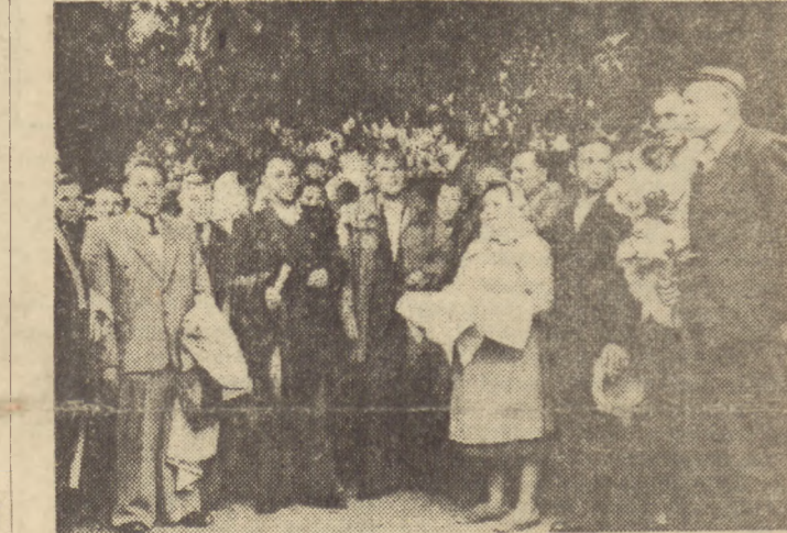
„Chlebem i solą witam was bracia na naszych drogach ziemniach oczyszczonych. Niech i wam ziemia w każdym roku daje więcej plonów tak, jak jest to u nas. Zapoznajcie się z naszą gospodarstwą, która rodzi ten chleb“.

Wieloletni zwłoczki tego zespołu, gdy do niedawna pracowali indywidualnie — nie wykonywały baz. Dopiero apel ZG ZMP podesłał je do czynu: zaczęły się troszczyć o rytmiczne wykonywanie dziennych planów, uważnie obsługiwały krosna, przeszły przeszkolenie metodą inż. Kowalowa i to pozwoliło im osiągnąć 117 proc. normy.