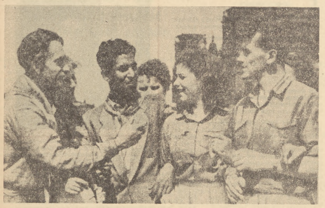
Przedstawiciele młodzieży polskiej, niemieckiej, czechosłowackiej i albańskiej na Placu Marksa w Berlinie podczas III Światowego Zlotu Młodych Bohowników o Pokój.

I znowu porównanie z budżetem angielskim będzie pouczające. Otóż rząd Churchilla postanowił w nowym budżecie wprowadzić szereg „oszczędności”. Czego one mają dotyczyć — zaraz się przekonamy. A więc Butler podał do wiadomości, że rząd ograniczy budownictwo mieszkaniowe i odbudowę zniszczonego w czasie wojny miasta oraz zmniejszy wydatki na służbę zdrowia o 5 milionów funtów sterlingów. Lecz główne ucięcia skierowano na tzw. subsydia żywnościowe, służące do pewnej regulacji cen artykułów pierwszej potrzeby. Subsydia żywnościowe obcięto w budżecie o 61 proc., „zaoszczędzając” w ten sposób na żołdakach mas pracujących 160 milionów funtów sterlingów. Butler ogłasza, że w trybunie parlamentu to sprzeczne z podstawowymi interesami narodowymi posunięcie rządowe — wyznał cynicznie, że spowoduje ono poważny wzrost kosztów utrzymania każdego członka rodziny w Anglii. Bardzo dobrze uzupełniają to obliczenia konserwatywnego „Dailly Express”, z których wynika, że po obcięciu subsydium żywnościowych cena chleba wrosnie o przeszło 12 proc., mąki o 36 proc., mięsa o 20 proc. itp.