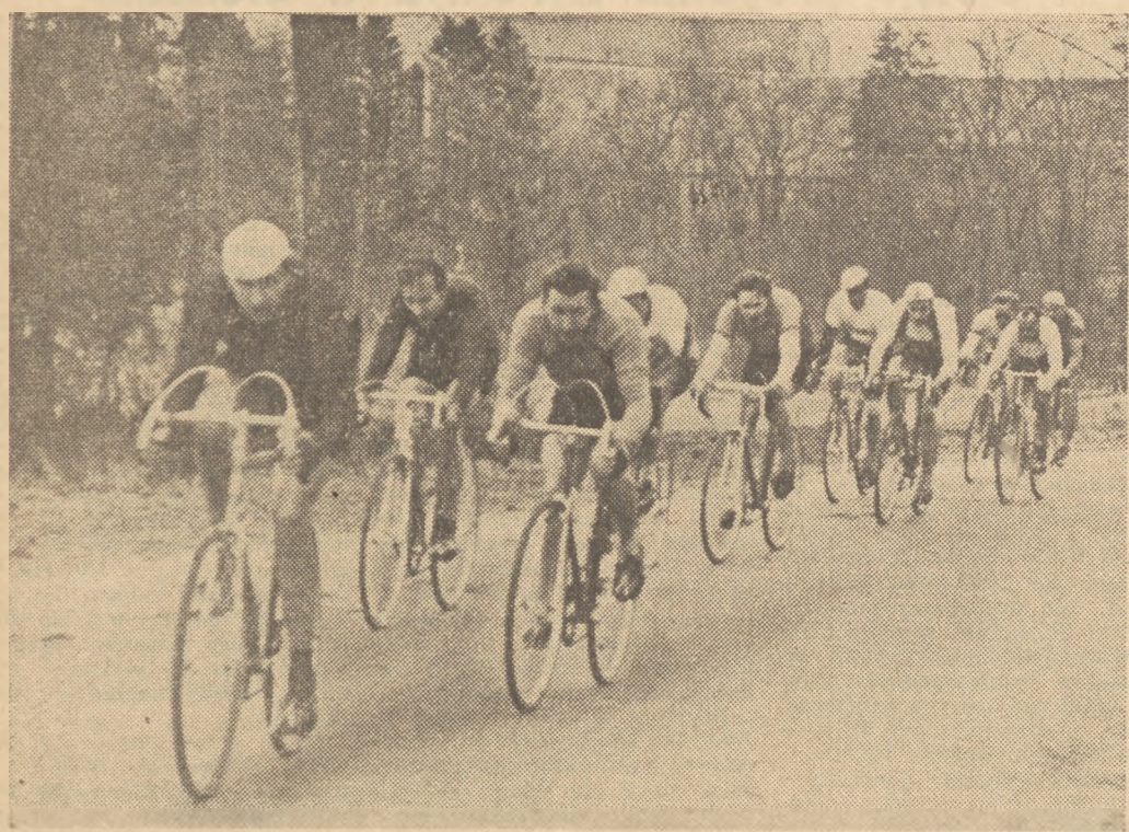
Dnia 6 kwietnia br. odbył się wyścig kolarski na trasie Berlin — Angermünde — Berlin, który miał ustalić definitywnie skład reprezentacji NRD na V Międzynarodowy Wyścig Pokoju.