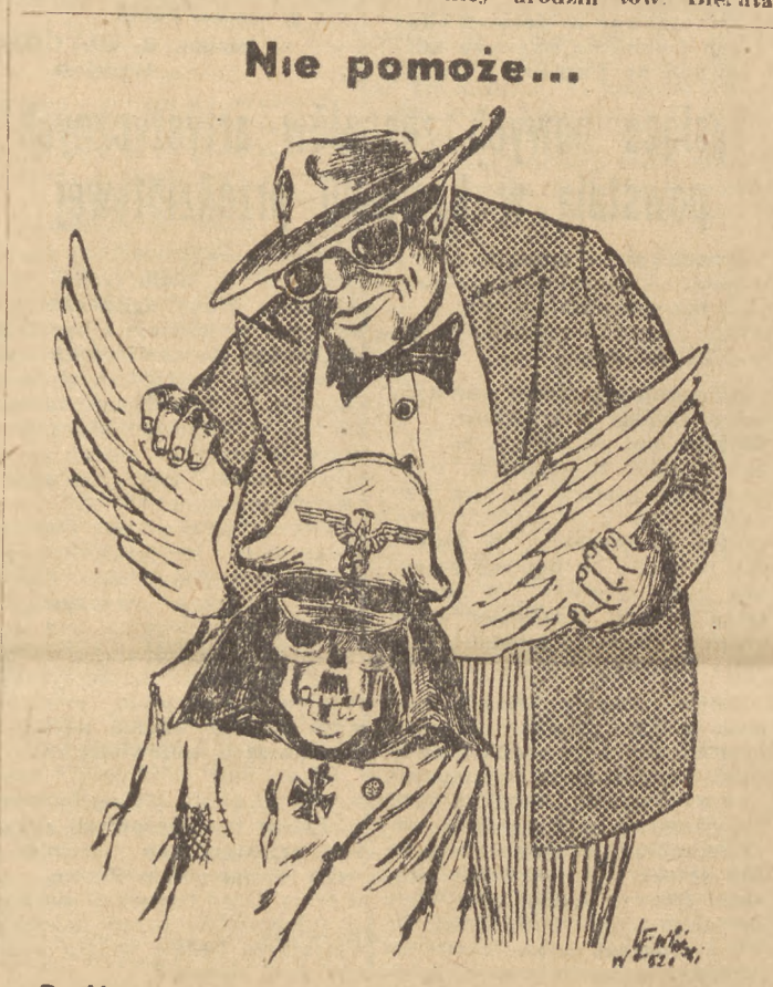
Podżegacze do nowej wojny „rehabilitują” hitlerowskich przestępców wojennych.

W czasie przerwy pierwszego dnia obrad młodzieży otaczała zwartym kołem delegatów Komsomolu prosząc o autografy i wzniesienie znaczki. Każdy chciał ukieszać dłoń komsomolcowi i przekazać swoje podziwowanie dla młodzieży radzieckiej.