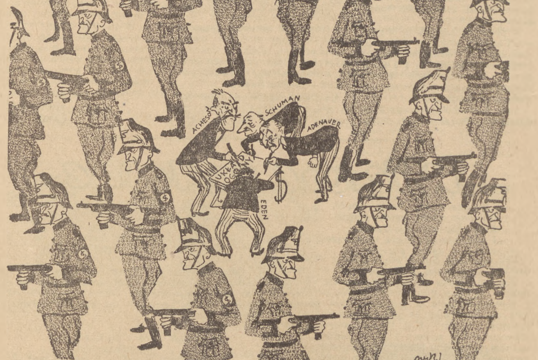
Podpisanie układu wojennego odbyło się pod ochroną 25.500 uzbrojonych policjantów, którzy zostali skoncentrowani w Bonn i jego okolicach.

Z całego kraju napływają dalsze meldunki o głębokim oburzeniu i protestach, jakie wywołało wśród społeczeństwa polskiego podpisanie przez marionetkowy „rząd“ Adenauera w Bonn militarystycznego „układu ogólnego“.