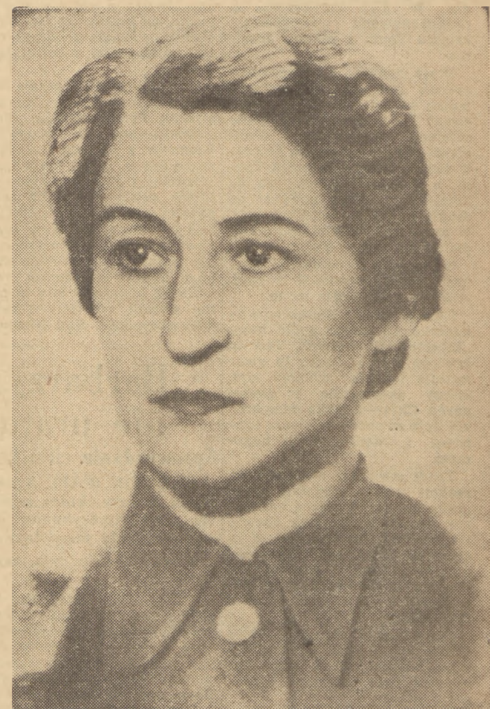
W Warszawie przebywa obecnie wybitna bojownicza o wyzwolenie Polski, organizatorka Związku Patriotów Polskich i Armii Polskiej na terytorium Związku Radzieckiego, czołowa działaczka międzynarodowego ruchu pokoju, znakomita pisarka odznaczona Nagrodą Stalinowską — Wanda Wasilewska