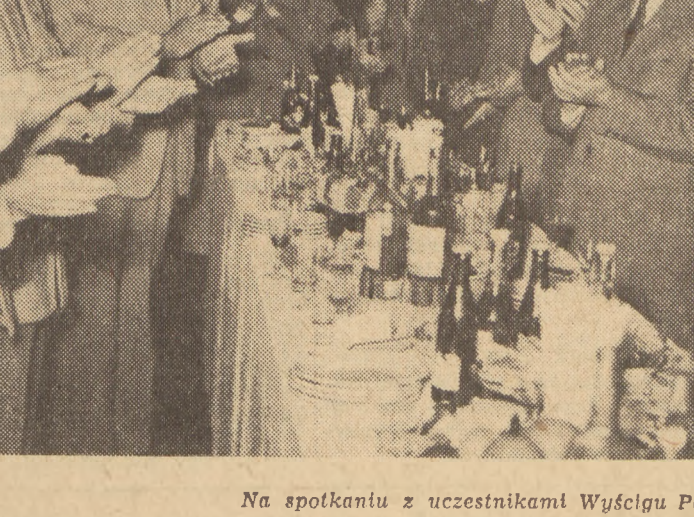
Na spotkaniu z uczestnikami Wyścigu Pokoju

Według doniesień waszyngtońskiego „Times Herald”, następcą Ridgwaya na Dalekim Wschodzie ma zostać generał Marc Clark .