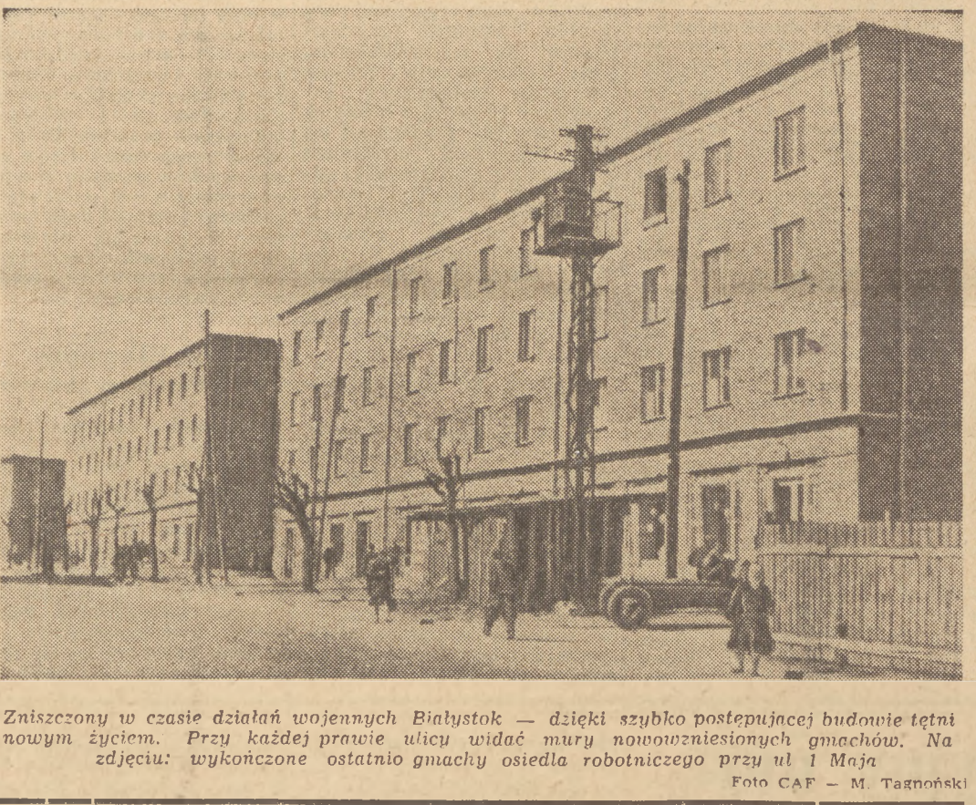
Zniszczony w czasie działań wojennych Białystok - dzieki szybko postępującej budownictwa...