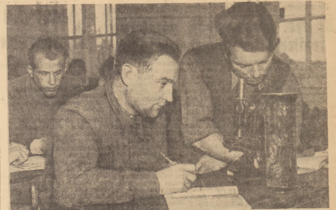
Podstawowe Szkoły Rolnicze kształcą specjalistów różnych dziedzin gospodarki rolnej. Uczniowie — to przeważnie robotnicy rolni, członkowie spółdzielni produkcyjnych...