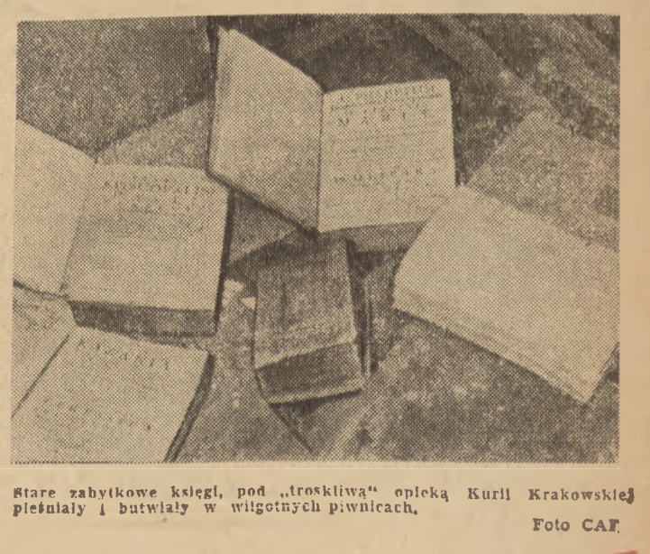
Stare zabytkowe księgi, pod „troskliwą” opieką Kurii Krakowskiej pieczętowały w wilgotnych piwnicach.

W Krakowie zorganizowana została wycieczka prasowa do piwnic Kurii Krakowskiej Kurii Metropolitalnej oraz domów na Wawelu, stanowiących własność Kapituły Krakowskiej.