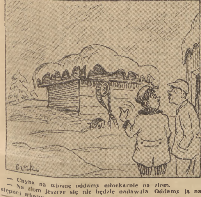
Chyba na wiosnę oddamy mleczarnie na złom...