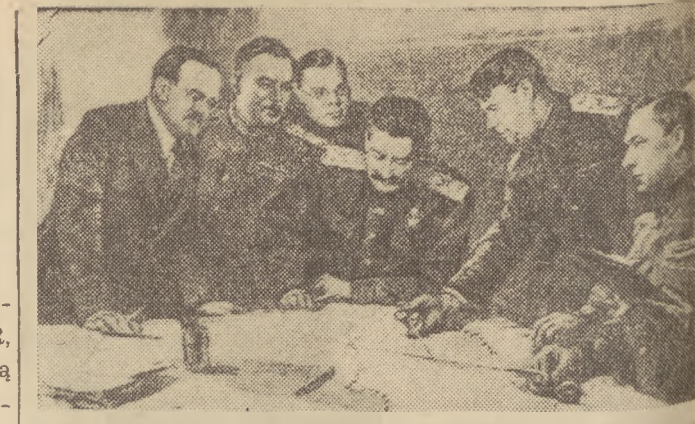
Twórcą niezłomnej potęgi Armii Radzieckiej, jej genialnym wodzem i nauczycielem, jest największy strateg naszych czasów, ukochany przywódca mas pracujących całego świata, GENERALISSIMUS JOZEF STALIN.

W trzydziestą piątą rocznicę Armii Radzieckiej naród polski i jego Siły Zbrojne wraz z całą postępową ludzkością ślą Armii Radzieckiej braterskie, serdeczne i gorące pozdrowienia, życząc jej dalszych wspaniałych osiągnięć w umacnianiu swej niezwykłej potęgi bojowej.