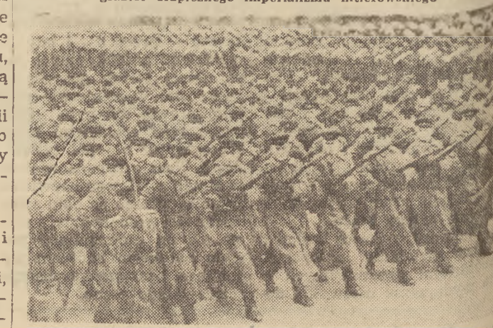
Potęga oręża radzieckiego, wsparta o wzrastającą moc ekonomiczną państwa socjalistycznego, jego przodująca technika i nauka wojenna, to nieugięta wola zwycięstwa narodu radzieckiego i całego grzbieta drapieżnego imperializmu hitlerowskiego.