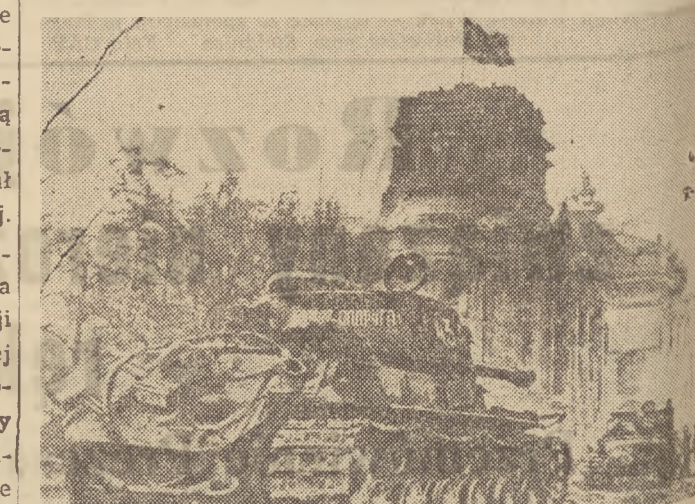
Pod jego kierownictwem powstał genialny plan rozgromienia hord hitlerowskich pod Stalingradem, co zapoczątkowało klęskę niemieckiej armii faszystowskiej.