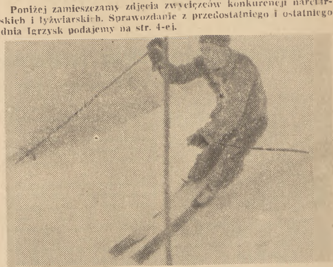
W stalomie-gigancie triumfował Józef Marusarz. Pokonał on m. in. swego najgroźniejszego rywala, Andrzeja Roja.

(Telefonom od naszego korespondenta) W dniu 1 marca br. odbyło się w Semmering zakończenie X Zimowych Akademickich Mistrzostw Świata.