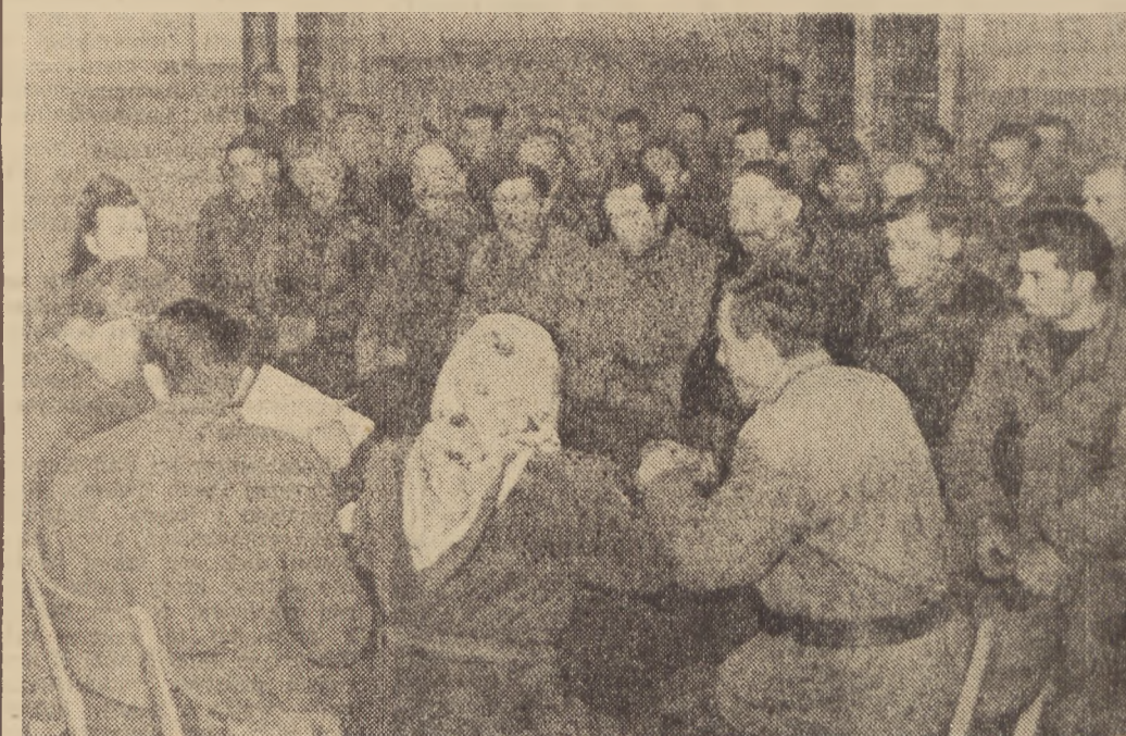
Zgodnie z Uchwałą Prezydium Rządu w sprawie wiosennej kampanii siewnej, przeprowa- dzono od dnia 10 bm. w gromadach, spółdzielniach produkcyjnych i POM-ach narady pro- dukcyjne poświęcone omówieniu przygotowań do prac wiosennych.

W Lubelszczyźnie 220 ekip ro- botniczych z 80 zakładów pracy utrzymuje obecnie ścisłą łącz- ność z 200 gromadami, 16 spół- dzielniami produkcyjnymi i 3 PGR-ami na terenie wojewódz- twa. M. in. prace uświadamia- jąca ekip Lubelskich Zakładów Garbarskich przyczyniła się do tego, że chłop w gromadach Jacków, Minkowice i Trzeck- ów podjęli zobowiązanie przed- terminowego wykonania ob- wiązków wobec Państwa i w po- stawieniu swego wywiązały się w 100 proc.