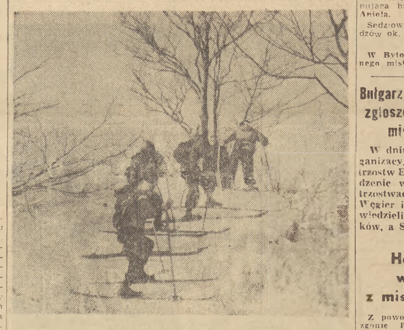
dobnej imprezy w okresie letnim. Słowa uznania należą się sędziom sportowym i zotowcom z Łucum Ogólnopolskiego w Krynic, którzy mimo ciężkich i trudnych warunków atmosferycznych, pracow-

Wyniki: Gwardia (Bydgoszcz) — Gornik (Bytom) 1:2 (0:0). Ognio (Tarnow) — Spojnia (Warszawa) 1:0 (0:0). Gwardia (Leszno) — Gwardia (Lublin) 0:0. Włokniarz (Łódź) — Włokniarz (Kielce) 1:1 (0:0).