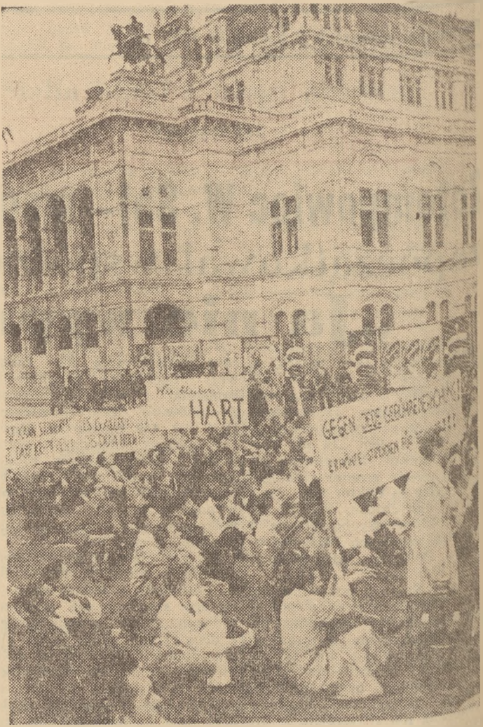
Manifestacja studentów Wiednia przeciw podwyższeniu opłat za naukę.

Walcia o plan, to walka o kadry dobrych fachowców. Organizacja ZMP-owska współodpowiada za wypuszczenie wysokokwalifikowanych fachowców, którzy umiejętności opanowania zawodu zdobywają przez naukę i szkolenie praktyczne na warsztatach.