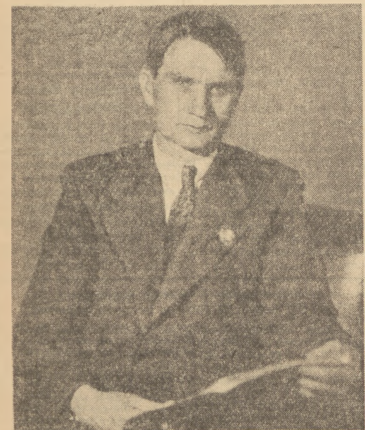
Prof. T. Łysenko — przewodniczący Wszechzwiązkowej Akademii Nauk Rolniczych

W dziesiątym myśli ludzkiej od dawna ścierały się ze sobą dwa sprzeczne poglądy na przyrodę. Jedni myśliciele widzieli w niej nagromadzenie przedmiotów i zjawisk w zasadzie niezmiennych, niepowiązanych ze sobą. Inni dostrzegali w przyrodzie ciągły ruch, zmiennność i wzajemne powiązanie zjawisk. Pierwszy kierunek — idealistyczny i metafizyczny panował niemal niepodzielnie w nauce długie wieki.