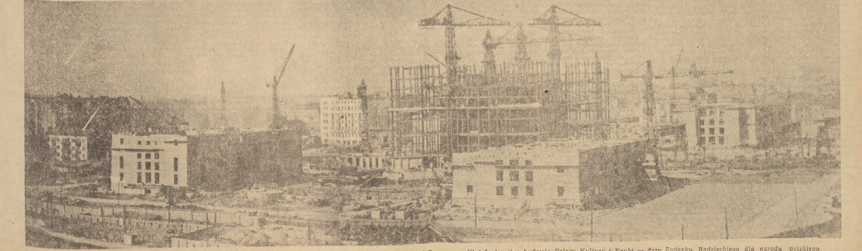
5.IV.1953 r. mija pierwsza rocznica podpisania w Warszawie umowy między Rządem ZSRR i Rządem Polskiej Rzeczypospolitej Ludowej o budowie Pałacu Kultury i Nauki — daru Związku Radzieckiego dla narodu polskiego. Na zdjęciu: widok ogólny budowy.

dalsze wzmocnienie Partii i Frontu Narodowego“ — wygłoszonego na VIII Plenum Komitetu Centralnego Polskiej Zjednoczonej Partii Robotniczej. Drugą część tego referatu nada Polskie Radio dnia 2 kwietnia o godz. 17.30 w programie I na fal 1322 m oraz o godz. 21.30 w programie II na fal 367 m.