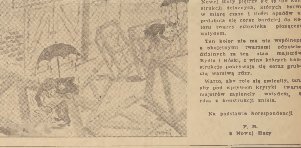
Przed warsztatem mechanicznym Nowej Huty pleczy się 40 ton konstrukcji żelaznych, których barwa w miarę czasu i ilości opadów spada, a podbina się coraz bardziej do koloru twarzy człowieka pływającego wstydem.

PROGRAM RADIOWY na dzień 25 kwietnia 1953 r. (sobota) Program I — na fall 1322 m. Program dnia 8.00, 15.25, 19.00, 20.00, 23.00.