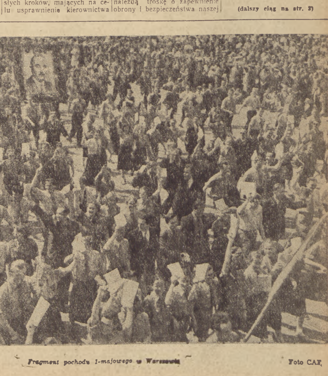
Fragment pochodu 1-majowego w Moskwie.

Ojczyzny: wzywa on do umocnienia naszych sił zbrojnych, abyśmy byli gotowi odeprzeć w każdej chwili podjętą przez jakiegokolwiek wroga siłę próbie przewrótka pokojowemu i zwycięskiemu marszowi narodu radzieckiego do swego wielkiego celu — do komunizmu. Toteż obowiązkiem składu osobowego Armii Radzieckiej i Marynarki Wojennej jest nieustanne doskonalenie swego kunsztu bojowego i bogacenie swej wiedzy wojskowej i politycznej. Towarzysze! My, ludzie radziecy, ufnie patrzymy w przyszłość. XIX Zjazd Komunistycznej Partii Związku Radzieckiego uzbroił partię i naród w jasny program marszu naprzód — do zbudowania komunizmu. Działalność naszej Partii i Rządu dowodzi niesłabnącej troski Rządu o dobro narodu, świadczy o właściwym kierowaniu życiem kraju. Ojczyzna nasza znajduje się w rozkwicie swych sił. Rozwijamy więc nadal nieustannie, z każdym dniem coraz bardziej, dźwigamy coraz wyżej naszą gospodarkę narodową, kulturę i naukę, umacniajmy i podnosimy nasze państwo socjalistyczne. Niech żyje 1 Maja — dzień międzynarodowej solidarności mas pracujących, dzień braterstwa robotników wszystkich krajów! Niech żyje bohaterki narodu radziecki i jego walczna armia i marynarka wojenna! Niech żyje Rząd Radziecki! Pod sztandarem Lenina-Stalina, pod przewodem Partii Komunistycznej — naprzód do zwycięstwa komunizmu! Hurra! Gdy marszałek Bułganin kończy swe przemówienie — zrywają się w wielu tysięcy ust potężny okrzyk — hurra!