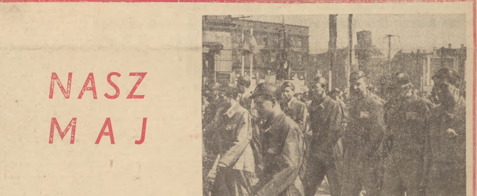
1 Maja 1953 roku w Stalino. Fragment kolumny górników.