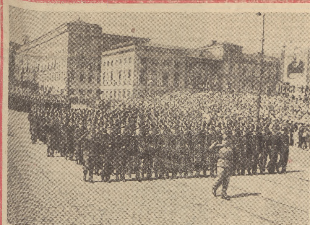
1 Maja 1953 roku w Warszawie. Działarsko defilują wychowankowie Korpusu Kadetów imienia gen. Karola Świerczewskiego.