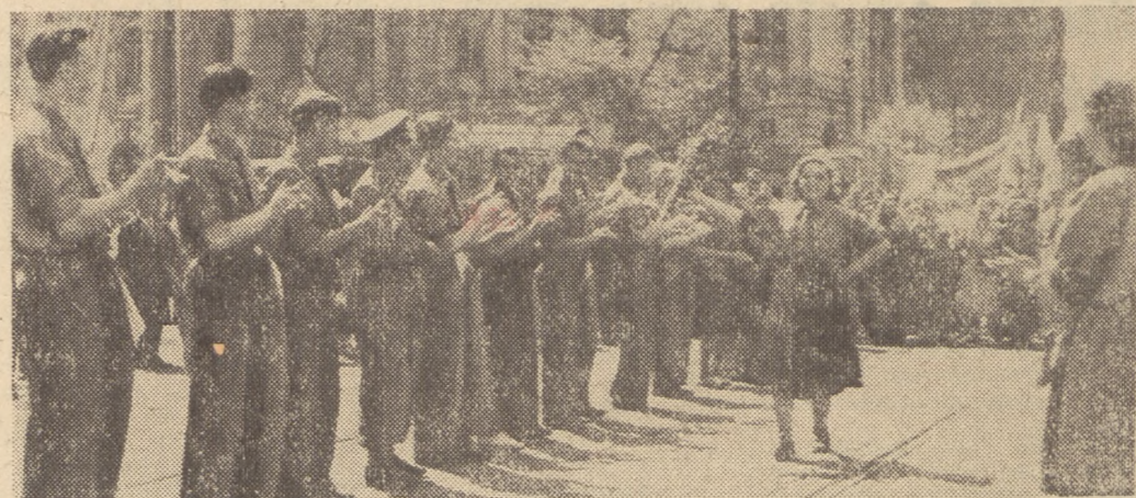
Szkoła kierowników świetlic wiejskich z Otwocka Wielkiego w tańcu „miotlarz” przed gmachem Zachęty w Warszawie w dniu Święta 1 Maja.