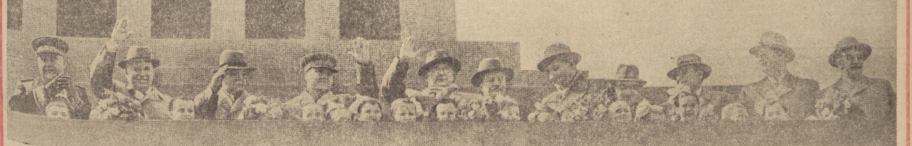
1 Maja 1953 roku w Moskwie. Na trybunie Mauzoleum Lenina-Stalina kierownicy KPZR i Rządu Radzieckiego przyjmują defiladę. Od lewej towarzysze: N. A. Bulganin, N. S. Chruszczow, K. J. Woroszyłow, G. M. Malenkow, L. P. Beria, W. M. Molotow, L. M. Kaganowicz, A. I. Mikojan, M. Z. Saburow, M. G. Pierwuchin, N. M. Szwernik.

1 Maj 1953 r. był w naszym kraju świętem zwycięzców szturmuje się do dalszych sukcesów. Był świętem polskiej szturmowej brygady, czerpiącej swe siły z braterskiej i przyjaźni ze Związkiem Radzieckim, z jedności naszego narodu, kroczącego śmiało naprzód do socjalizmu pod kierownictwem Polskiej Zjednoczonej Partii Robotniczej na czele z towarzyszem Bierutem.